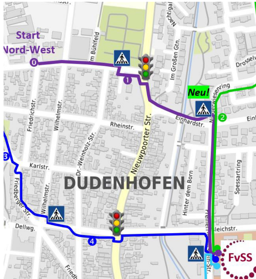
Abb. 1: Teilausschnitt aus Laufbusplan FvSS, Linie Nord-West